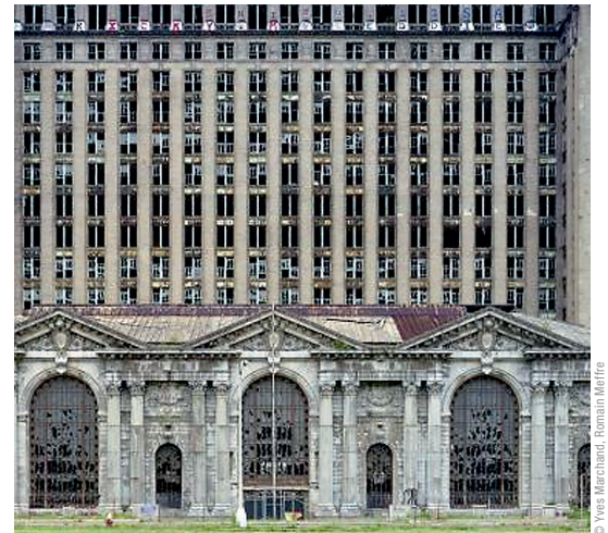
Schrumpfende Stadt (Detroit, Michigan Central Station)

Arbeits-/Umsetzungshinweise Das Arbeitsvorhaben erfolgt in mehreren Unterrichtsstunden, in denen sich die Schülerinnen und Schüler in arbeitsteiliger Gruppenarbeit mit jeweils einem Teilaspekt befassen. Im Sinne des kooperativen Lernens sollen in einem zweiten Schritt die Experten für die jeweiligen Teilaspekte ihre Mitschüler über ihre Ergebnisse informieren (Quergruppen). Gemeinsam diskutieren die Lernenden danach die Frage nach Gemeinsamkeiten und Unterschieden für die beiden bearbeiteten Phänomene und formulieren eine strukturierte Antwort auf die im Thema enthaltene Frage. Die Ergebnisse sollen auf einem Handout festgehalten werden.