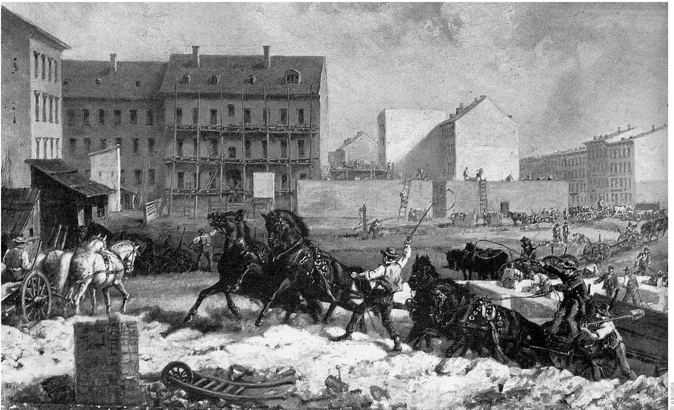
Tempo der Gründerzeit (Berlin 1875, Bau der Grenadierstraße, heute Almstadtstraße)

Arbeits-/Umsetzungshinweise Dieses Projekt umfasst zwei bis drei Unterrichtsstunden in arbeitsteiligen Gruppen und mündet in einer gemeinsamen Präsentation der Ergebnisse. Die einzelnen Gruppen können jeweils einen Baukasten geschlossen bearbeiten oder sich durch eine gezielte Auswahl aus den Baukästen 1 bis 4 einen eigenen Baukasten zusammenstellen. Dafür ist eine Absprache zwischen den einzelnen Gruppen erforderlich.