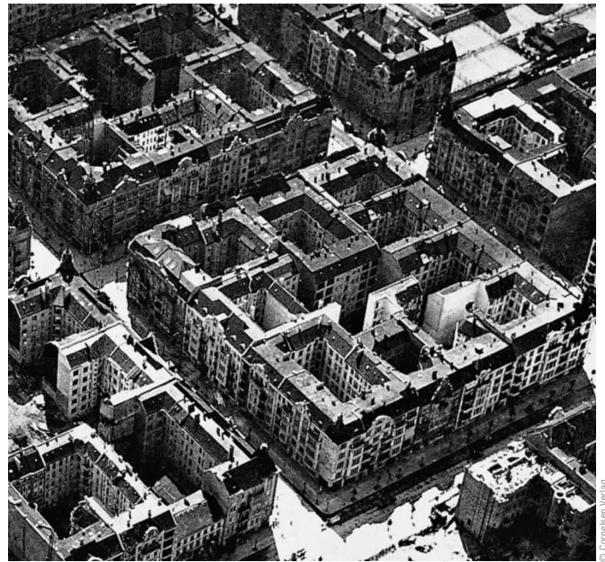
Mietskasernen um 1900