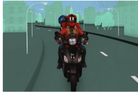
Ausschnitt aus dem Video „Das Gesetz der Straße: Folge 5“

Wer mit dem Moped oder Motorrad im Straßenverkehr unterwegs ist, sollte einige Dinge beachten. Schaut euch das Video „Folge 5: Motorisierte Zweiräder I Das Gesetz der Straße – mit Ralph Caspers“ an und beantwortet anschließend folgende Fragen: